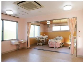
特殊浴槽です。身体の状 態により個浴・リフト浴 を完備しております。