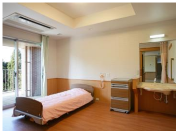
プライバシーを重視した 自由な生活空間です。

老人福祉の理念に基づき、入所者に対する敬愛の精神を忘れることなく、真の生活の場としての環境条件を整えるとともに、真心のこもった正しい処遇を行うことにつとめ社会性豊かなホーム作りを目指します。